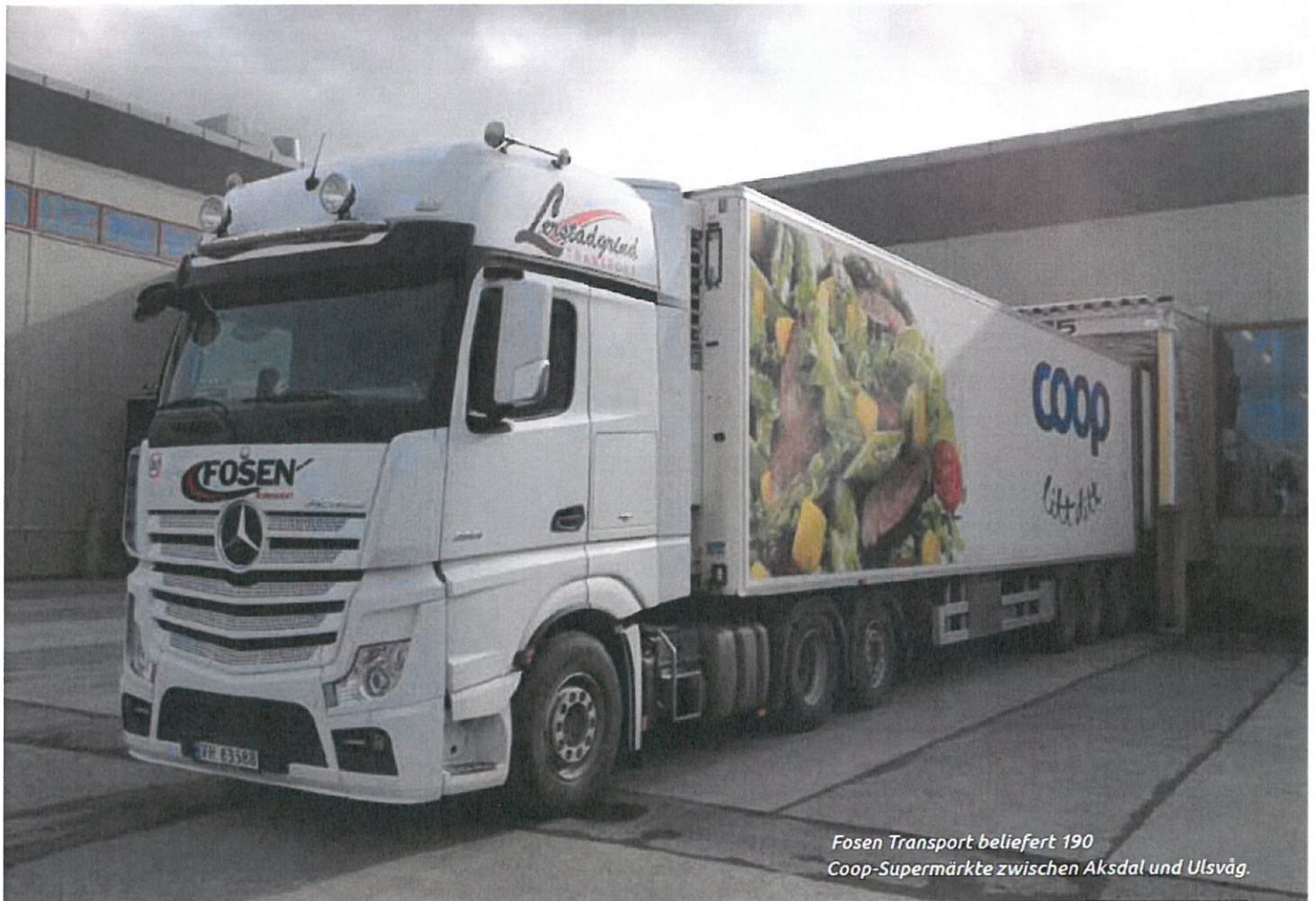
Fosen Transport beliefert 190 Coop-Supermärkte zwischen Akksdal und Ulsvåg.