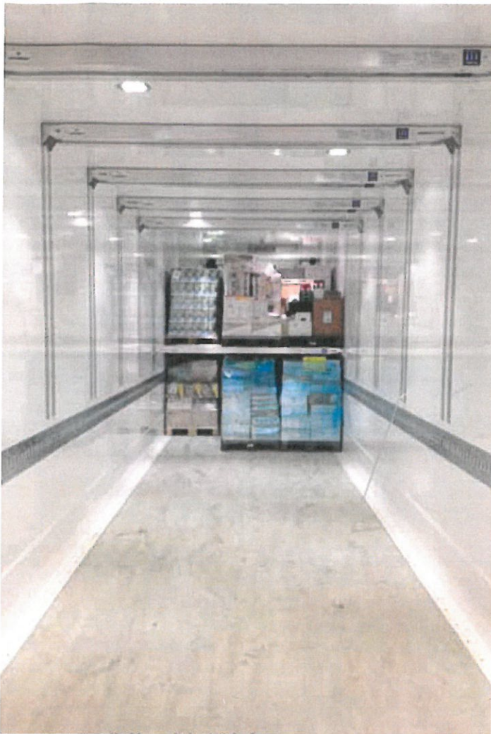
In den Wänden montierte RFID-Antennen erfassen auf den Lkw verladene Waren.